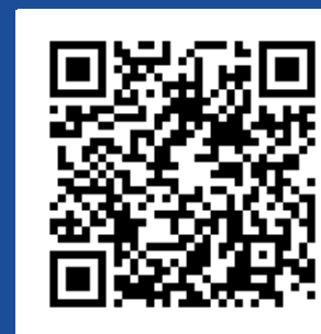
Видео-инструкция по замерам